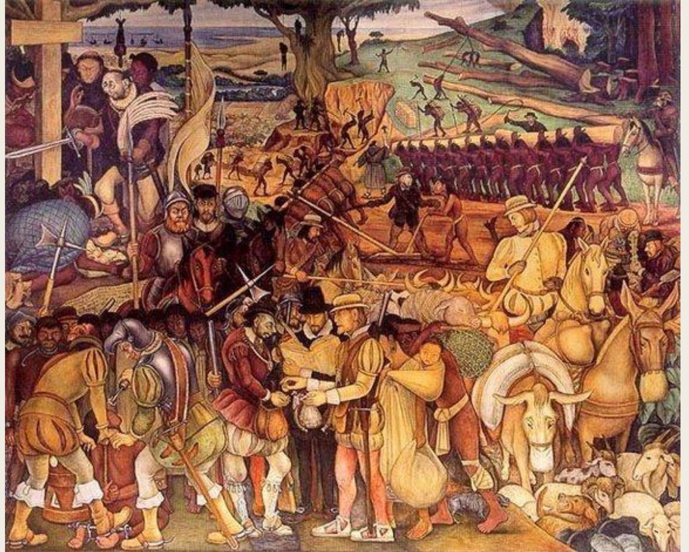
Mural de Diego Rivera, Palacio Nacional de la Ciudad de México, 1936. La llegada de Hernán Cortés a México. La conquista española de la nación azteca.

El sujeto pedagógico quedó constituido por la relación entre sujetos políticos y sociales con poder y derechos desiguales. Clases dominantes enseñan mediante la instrucción pública a clases dominadas; sectores urbanos transmiten mensajes a sectores rurales; el sexo dominante impone su cultura al conjunto; las generaciones adultas someten a las generaciones jóvenes.